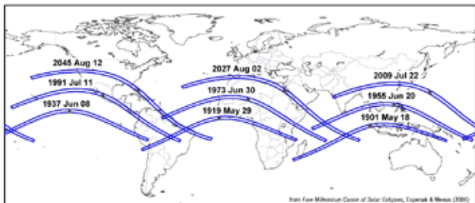
Figuur 1 - Eclipsen from Saros 136: 1901 tot 2045, als voorbeeld van een Sarosserie.