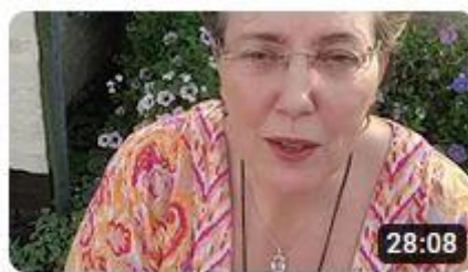
Veranderingen voor najaar 2023 en 2024, financieel,...

De veranderingen die zich afspelen eind 2023 en in 2024 zijn veelomvattender dan alleen voor de hele planeet aarde. De veranderingen zijn op een nog groter niveau van omvattendheid ook al zichtbaar, want in ons zonnestelsel zijn er ook grote veranderingen bezig. De Zon is begonnen aan een poolshift, die iedere 11 jaar plaatsvindt. Ik heb een apart artikel geschreven over de veranderingen in ons zonnestelsel. Lees in dit speciale artikel wat wij daar van kunnen merken. Je kan meer lezen in de special over de Zon op mijn website: https://inzichten.com/special-over-de-situatie-op-de-zon-met-de-aanstaande-poolshift/